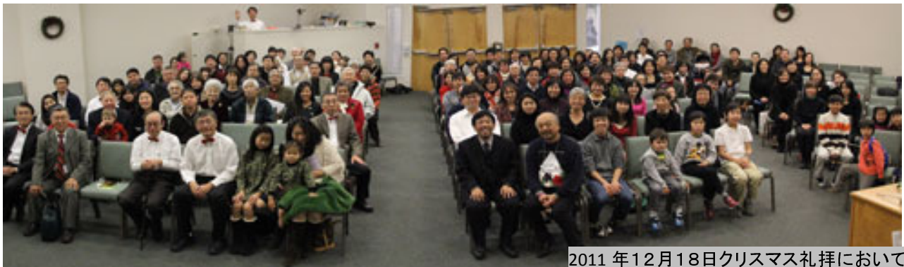
2011年12月18日クリスマス礼拝において

「神はそのひとり子を賜わったほどに、この世を愛して下さった。それは御子を信じる者がひとりも滅びないで、永遠の命を得るためである。」ヨハネ 3:16